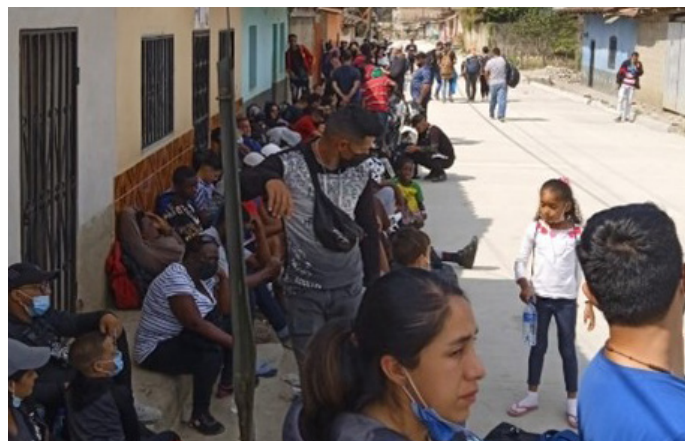
Alojamiento proporcionado por parte de familias en Danlí y en una calle.